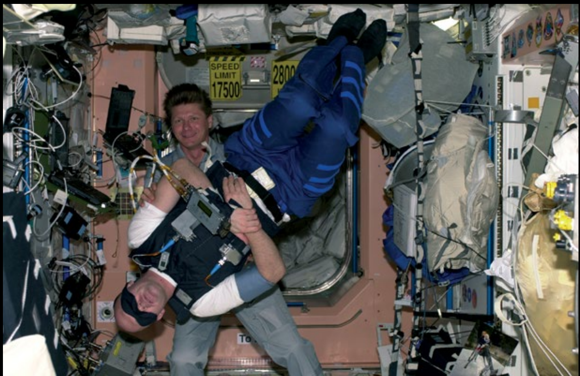
Saol an spásaire CEACHT 38