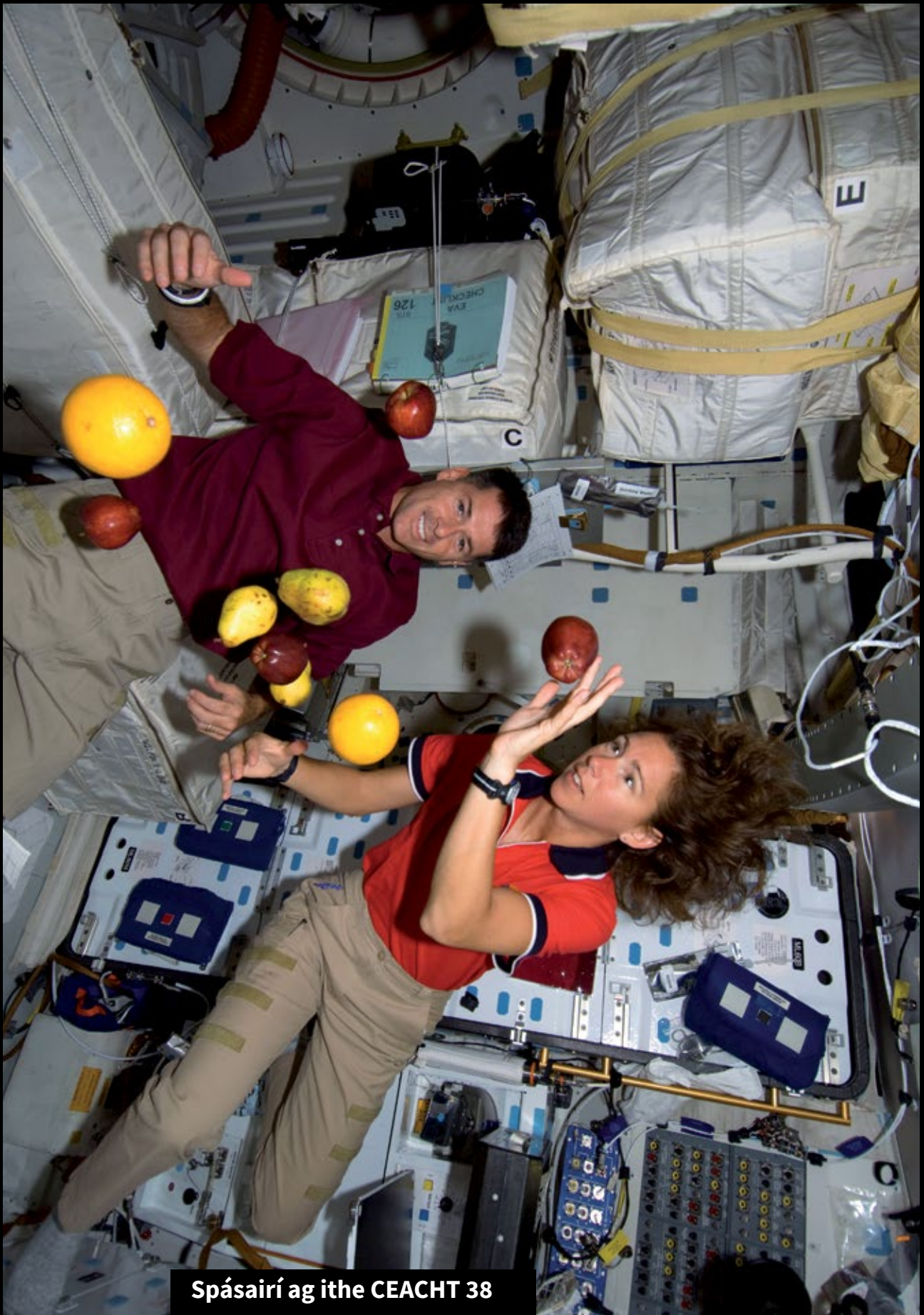
Spásairí ag ithe CEACHT 38