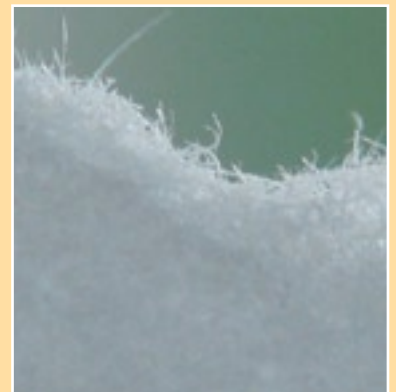
Snáithíní ag gobadh amach as imeall bhileog páipéir